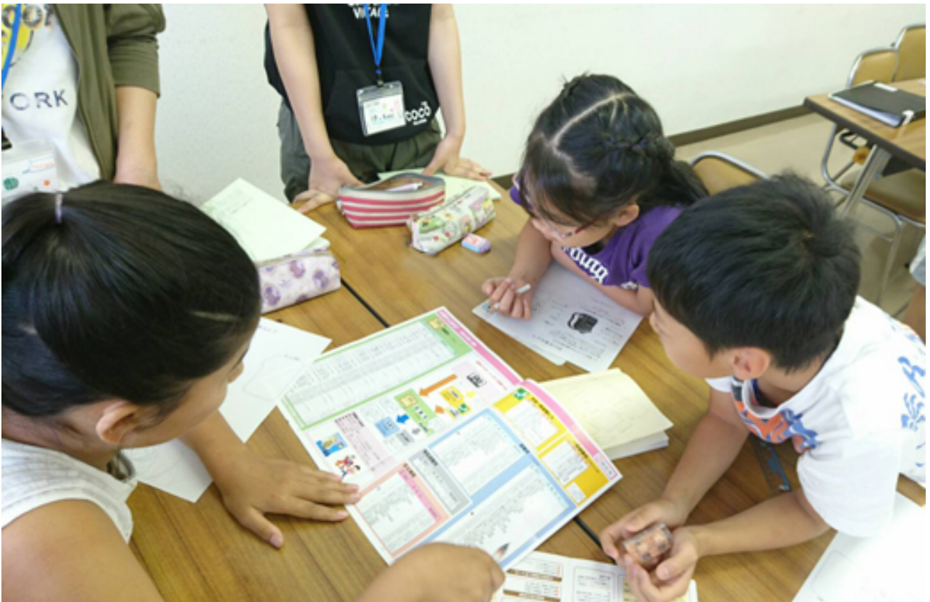
グループワークの様子（小学生）